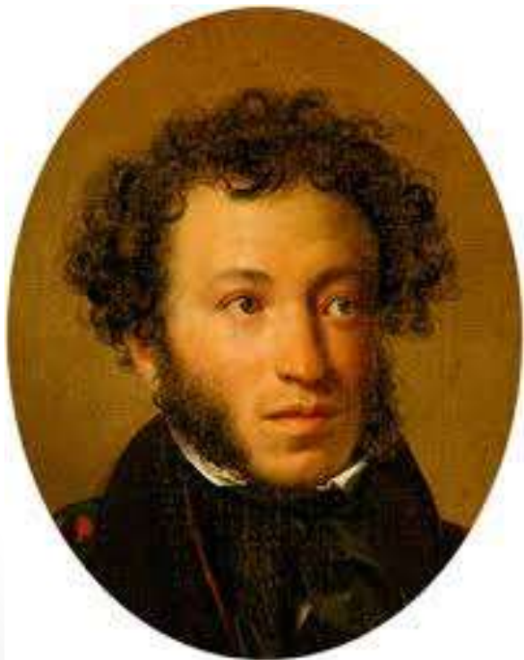
Пушкин Александр Сергеевич